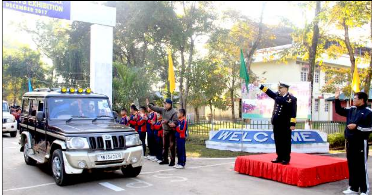
সাইনিক স্কুল ইমফাল এলুম্বাই এসোসিয়েশন এডভেঞ্চার ক্লবনা শীড়না নোথ ইস্টকী স্টেটশিংদা গুদরিল মিসনগী কার রেলিং স্কুল অসিগী প্রিন্সিপালনা লমথাবা