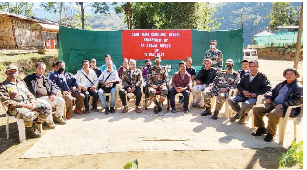
৪৪ শুরা অসাম রাইফলসনা শিন্দুনা কাংপোকগী দিষ্ট্ৰিক্টকী মন্থ চনবা গেলনেল ভিলেজনা পাঙথোকখিবা অহল লমনশিংগী ওইবা মীফয়েন

ওফিসলশিং অদুনা হায়, ফায়ৰ এন্ড ইমজেলি সৰ্ভিসেসকী পৰ্সনালশিংনা ফায়ৰ ফায়টৰ ইঞ্জিন কয়া শীজিম্বা পুং কয়া চুপা থাখিৰবা মৌহৌ লাগোক অদু লাৰ্কশিম্বা কয়া হোংনব্রস ইয়াই নুমিত্তা থৌদোক অদুনা দি সী ওফিসকী অয়াঙ্গা শৰুক উং ওনত্ৰে।