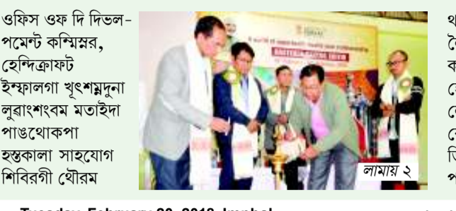
ওফিস ওফ দি ডিভেলপমেন্ট কমিশনার... লামায় ৩