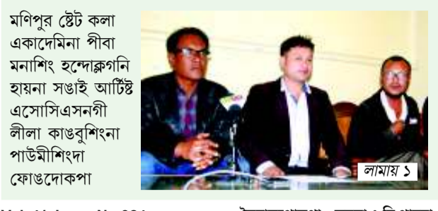
মণিপুর স্টেট কলা একাদেমি... লামায় ১