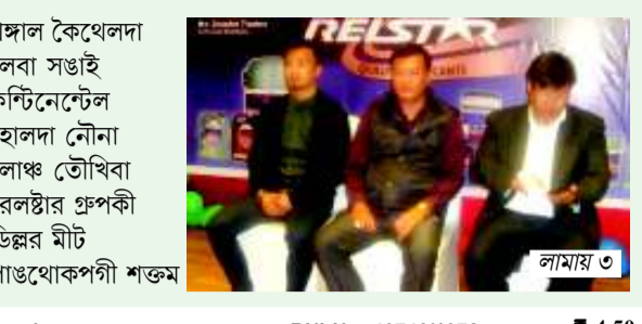
থঙ্গাল কৈথেলদা লৈবা সঙাই কন্ট্রিনেটেল হোলদা... লামায় ৩

Vol. 41, Issue No. 324 লৈবাকপোকপা, লমতা ৫ নি পানবা, অপূনবা লামায় মশিং ১২ HUEIYEN LANPAO, Tuesday, February 20, 2018, Imphal www.hueiyenlanpao.com RNI No. 40746/1978 ₹ 4.50