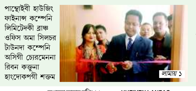
পাছোইবা হাউজিং ফাইনাল কম্পেন্সি... লামায় ২