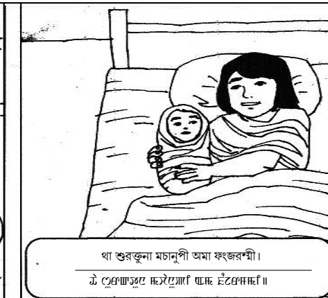
অঙাদু অসু-অসু মা ওংখলক্ৰশী।

SECL Recruitment 2021 www.secl-cil.in: South Eastern Coalfields Limited (SECL) Bilaspur (Chhattisgarh) invites online applications for recruitment of Assistant Foreman, Store Issue Clerk and Assistant Loading Clerk positions. The last date for submission of applications is 24th March 2021.