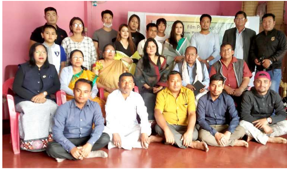
দৌসুয়ালি ফিল্ম প্ৰদৰ্শনীৰ বেনৰ মখাদা ৱৰ্ল্ড এন্টৰপ্ৰেন্স পিকচাৰনা প্ৰজেক্ট তৈৰী 'অশেংবা ইৱল' হায়না মিথোনবা মণিপুৰী ফিল্ম অমা কাকৈখেল মোইয়াংপুৰেলাদা লৈবা ফিল্ম অসিগী প্ৰদুসৰ খোমদাম দোৱেদেগী যুদনা পাঙথোকখিবা যাইফ যৌনি খৌৱমদা শৰুক যাইখিবাং

সেন্ধৰ অমসুং এন এস সী এন (আই এম) গা যানৰে হায়না মায়কৈ খৰদকী ফোণ্ডেদাৰক্ৰিৰ বাবে ইমপ্লিমেন্ট তৈৰী কৰিবলৈ হায়না নাগালেণ্ড কোংগ্ৰেছনা ফোণ্ডেদাৰক্ৰি।