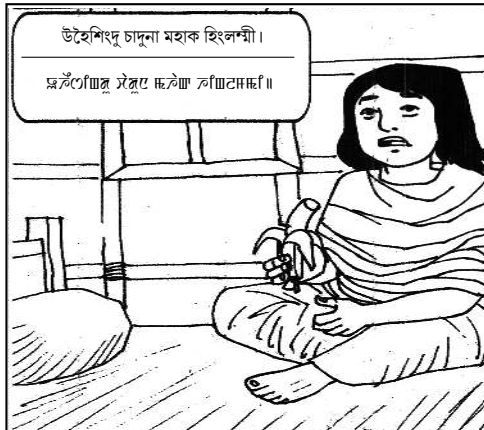
উইশিঙী চাদুনা মহাক হিলেশী।

হন্দক পাঙথোক্ৰেদাৰিবা এসেমব্লি ইলেক্ৰন অসিদা অসামদা কোংগ্ৰেছনা লৈঙাক পায়ৰা ওইবদি নুমিৎ ৩৬৫ নি টি ৱাৰ্কৰশিংগী খুংশুমন মপুং ফানা ফঙহনগনি। অমদি নোংমগী খুংশুমন লুপা ৩৬৫ ওইহনগনি হায়ৰি। কোংগ্ৰেছকী মৰ ওইবা এঞ্জেলদাশিংগী মনুংদা অসামগী টি ৱাৰ্কৰশিংগী নোংমগী খুংশুমন লুপা ৩৬৫ দা হেনগংহনবা হায়বসিসু অমনি।