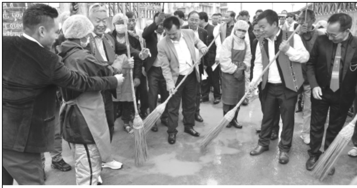
উত্থল টাউন্ডদা ট্ৰাইবেল এফিয়াস এন্ড হিলস অমসুং ফিশারি মিনিষ্টর এন কয়াসিনা লুচিংবা টিমনা অমোৎ-অকাই শিং- শেংবগী কেম্পান চখবা

ট্ৰায়াস/খোঙ হান্না যাদবা, খোঙ হান্নাগুয়া য়ায়া লিকা হান্না, ফন্থী শোনবা, খোঙয়া শাবা, তাং তাং চিকপা, গুকাশম মরি অমদি লেঙজুমদা চিকপা নাবা, খাঙু নাবা, অমাঙথোং মনুংদা পোন্গা তংলাগা লৈবা, খোঙ অকনবা হান্না মতমদা তংলাগা লৈবা অদুদা অমাঙথোং মনুংদা খুং থিনজিল্লাগা য়েংবা মতমদা অমাঙথোং মনুংদা পোন্গা মতম ওইনা তংলাগা লৈবা, খোঙ অকনবা হান্না মতমদা তংলাগা লৈবা অদুদা খেংলাগা ঈ দ্রোপ দ্রোপ তারকপা, ঈ তাখিবা অদুদা মরম ওইদুনা নোংম-নোংমগী হকচাং শোকচিল্লকপা অমদি ঈ কংশিল্লকপা, খোঙয়া শাবা, তাং তাং চিকপা, ফন্থী রাংগা, খাঙু নাবা, গুকাশম মরি অমদি লেঙজুমদা চিকপা নাবা তৌরনা অদু MD. Zia-UI-Haque Phusam 9615256612, 8414825323