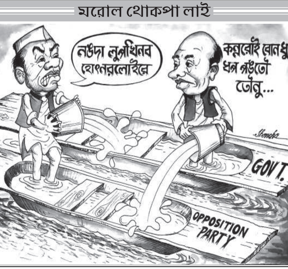
পাউচে অসিদা ফোঙজরিবা রাহংশিং অসিগী রাখল, মিংয়েং অইবা মশা মশাগীনি। পাউচে অসিগী রাখলোন অমসুং মিংয়েংগা থেইদোক্লগা মরী লৈনদে।