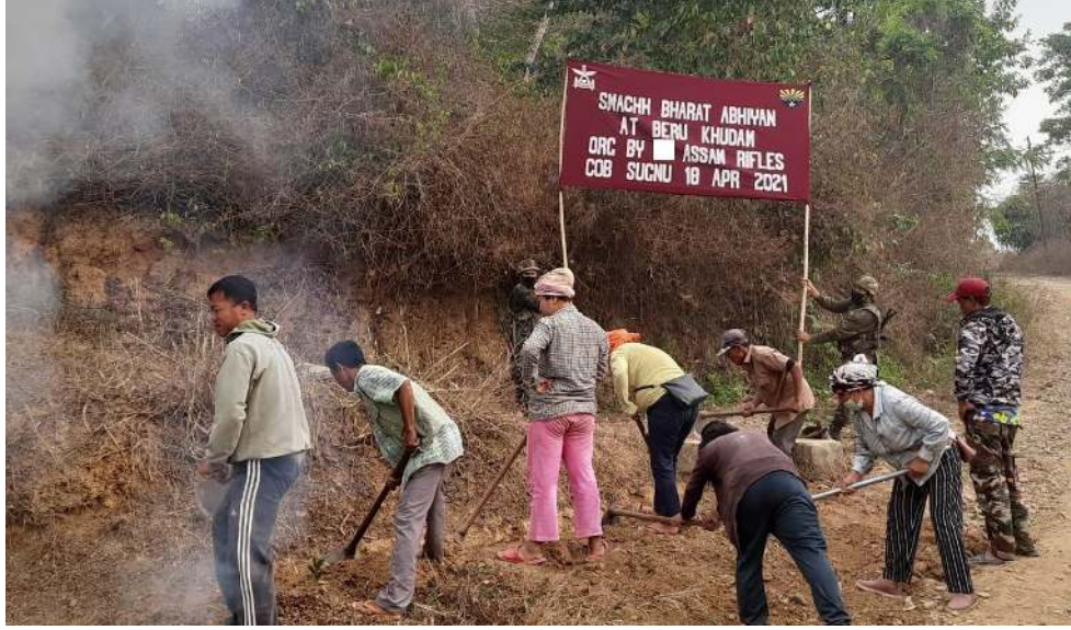
আই জি এ আৰ (সাইথ) কী মীংয়েং মখাদা ককচি বটলিয়নগী ২৮ সেক্টৰ অসাম ৰাইফলসনা শীন্দুনা ককচি দিষ্ট্ৰিক্টকী মনুং চ্যা লেবা সুদুগী বেক খুদাম ভিলেজনা পাঙথোকখিবা ক্লিনলিনেস ড্ৰাইভকী থোৱমদা শৰুক যাবিবা খুঞ্জাশিং