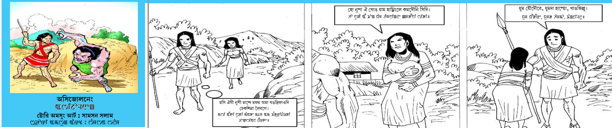
অসিজোলনেং... টোৱি অমসুং আৰ্ট : সামসন সলাম