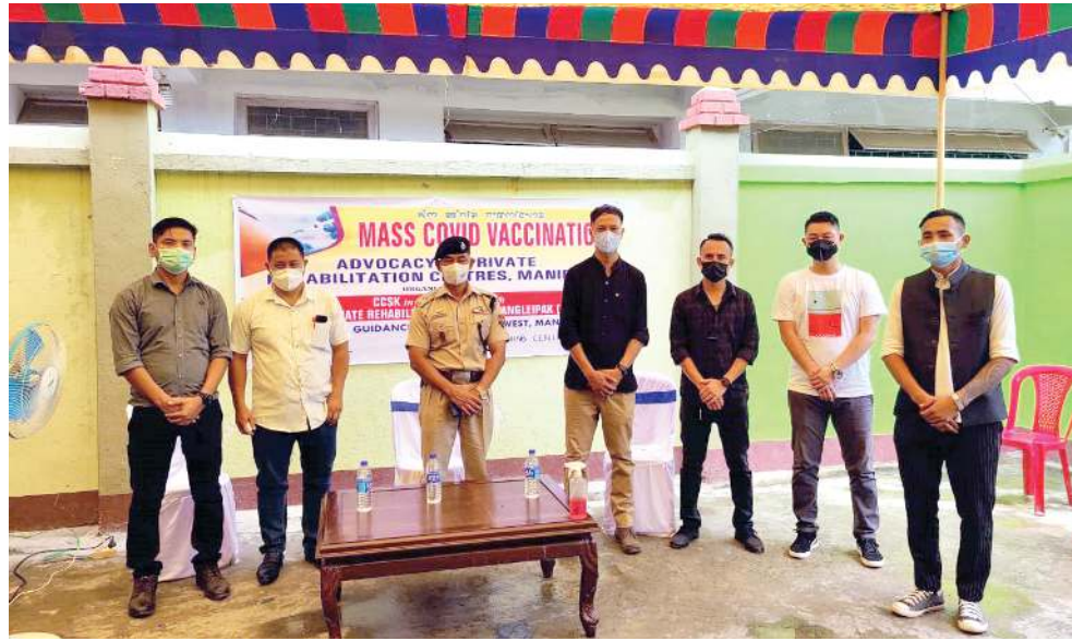
কমিটি ওফ সিডিল সোসাইটি কলৈপাক (সী সী এস কে) অমসুং যুনিয়ন ওফ প্ৰাইভেট ৰিহেবিলিটেশ্বন সেন্তৰ কলৈপাক মণিপুৰনা ইফাল ৰেট্ৰেডি সীসী লিডিং মখানা মাস ভেলিন এন্ড এডভোকেচন প্ৰোগ্ৰাম ইন প্ৰাইভেট ৰিহেবিলিটেশ্বন হায়না মিথোনবা যৌৱন অমা প্ৰাইভেট ৰিহেবিলিটেশ্বন সেন্তৰ শিংগা পাণ্ডখোকপা হৌখিবা

দিমা পুৰ, জুলাই ১৯ (এজেন্সী): ক্লিং অমসুং ওপোজিসন পাৰ্টিশিংগী লেজিসলেটৰিংগা... কোৱাৰ্টাৰী শালগনি।