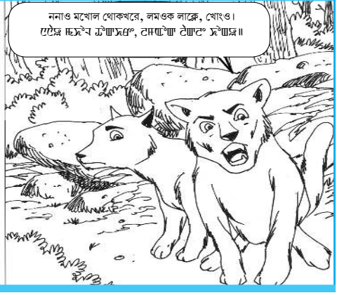
ননাও মখোল খোকখাৰে, লমওক লাক্ৰে, খোঙও।