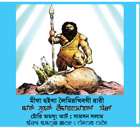
মীগা হুইগা লৈমিখিবগী ৱাৰী মদুদি ক্ৰাফ্ট টেমপ্লেটখোঁৱাং মেগ্ৰ