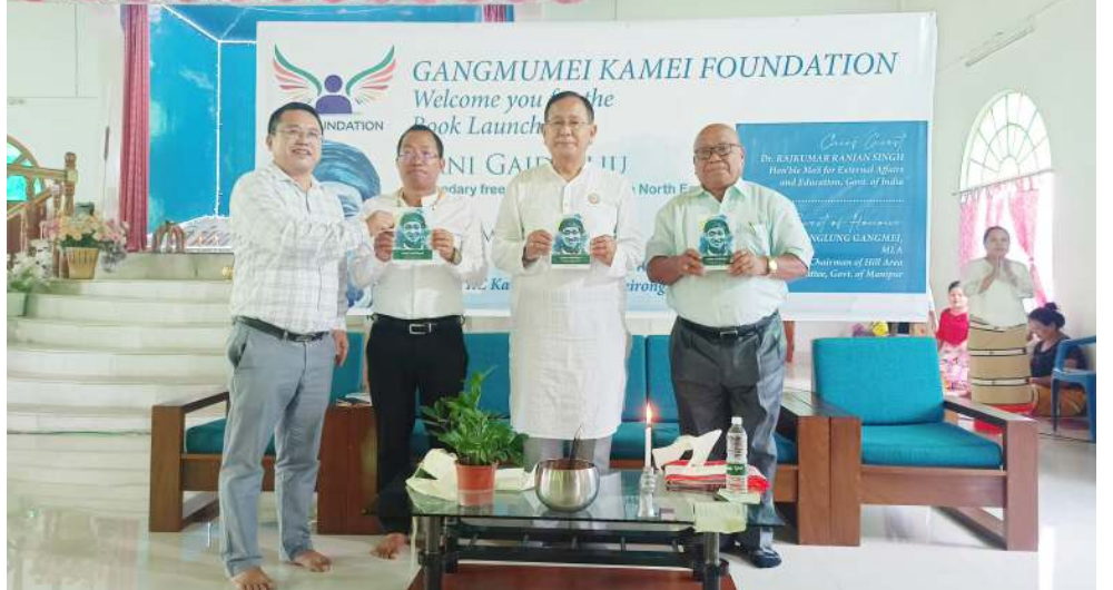
সোম কাইমেনা ইবা ৱানি গাইদিনলিয়ু লিজেণ্ডৰি ফ্ৰিডম ফাইটৰ ফ্ৰোম দি নোৰ্থ ইষ্ট হায়না মিংথোনবা লাইৱিক দিগ্ৰিটৰিশিংনা ফোঙখিবা

মখোল তাবদগী পেট্ৰোলিং চংলহাৰ বি এস এফ পৰ্সনেলশিং আউট পোষ্ট তল্লা লাকখি। অদুৰ ওমখৈগী ৰাংমদগী চখৰকখিবা এটেক ওইখিবনা চেৱিৰা লালহৌবশিং অদু ফানা হোংনবনা খুদোংচাদবা কয়া মায়েজুৰি। এম্বুসকী পাউ হেক ফংগা মশিং য়াৱাৰ পুলিস টিম অমসু থৌদোক থোকফমদা থুনা য়াৱা চঙলকখিবা লায়ননা হেলিকপ্টাৰ শিঞ্জিদুনা থিখিবা থবক চখখি হায়রি।