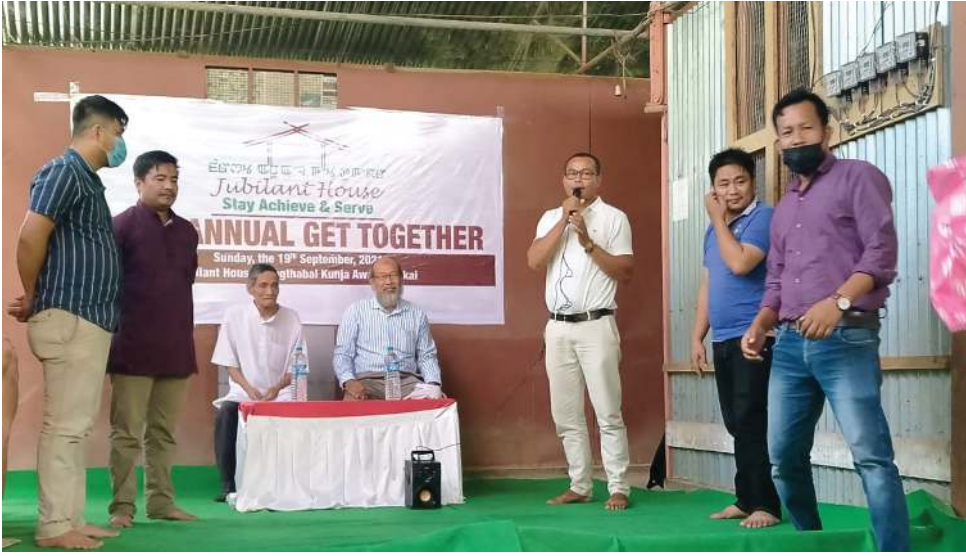
लांथावाल कुञ्ज अरा लैकामा लैवा जुबिलाट हाइसकी अहानवा गेट-टुगेदर थौरमदा शकक याथिवा जुबिलाट हाइसकी एनर (येथे), कोर टेकर अमदि जुबिलाटस खरा