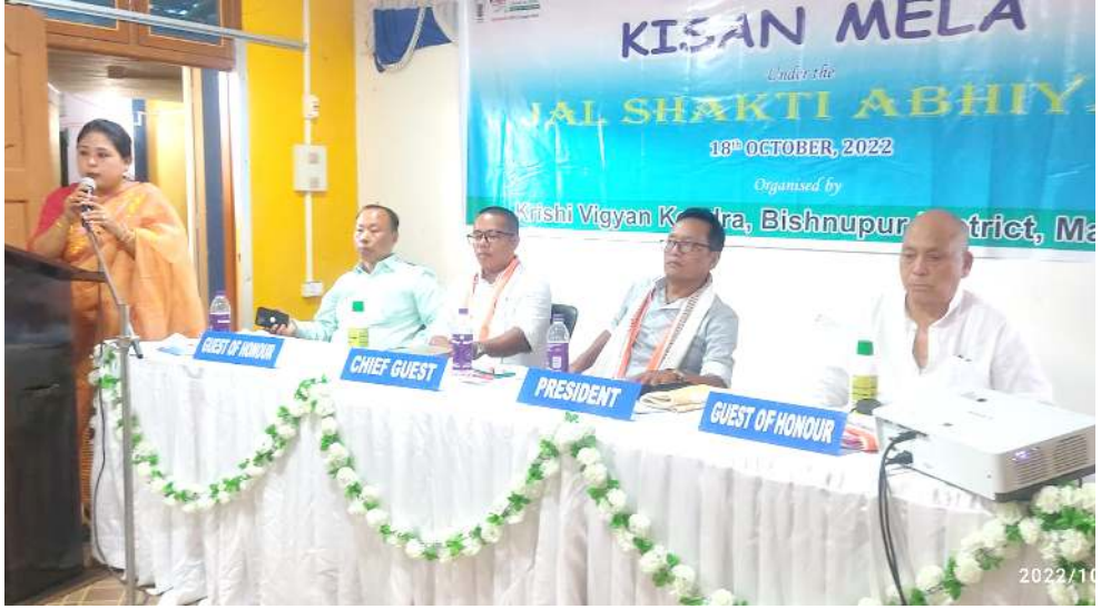
ফ্রিসি বিজ্ঞান কেন্দ্র, বিশ্বপুৰনা শিশুনা কেন্দ্র অসিগী কেম্পাসত পাঙথোক্কিবা কিসান মেলা কম এৱারনেন্স প্রোগ্রামগী খৌৱমদা দাইস মেম্বৰ ওইখিবশিং

মশাগী কামনবা হোৎনবদা মীয়ামগী রাইটশিং মপুঙ ফানা ফংসদনা থল্লিবা কাঙবুনি হায়বসি মীয়াম্মা হেমা খঙনবদা রাফম অমনি। মরম অদুনা স্টেট অসিগী মীয়াম্মা মথং চহীগী অঙনবা শরুত্তা পাঙথোক্কদৌরিবা মীখল অসিদা বি জে পিগী পারা শোয়দনা তদ্বীরগনি হায়রি। মহাক্সা মথং তানা হায়, সেন্টরদা বি জে পিগী ওইবা লৈঙাক অমা লৈবনা মরম ওইরগা বি জে পিগী লৈঙাক পায়বা স্টেটিংগা চথরিবা অরানবা থবক কয়া অসিবু সেন্টরদা তুমিমা য়েংদুনা লৈখোক্কি। অমদি ওপোজিসনদা লৈরিবা পাটিশিংগী লুচিংবিশিংবু মুশফম য়াওদবা মরাল কয়া পীশিনবা অমদি লেপুনা খুনিচী ওইবা গেং খুংপুশিংনা এটেক চথহনবগী খৌদোকসু চুথে হায়না মরাল শিরিকি।