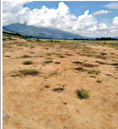
কৌত্রুংকী হৌজিক ওইরিবা ফীভম

চহী অহম ফারক্কৌরবা মতমসিফাওবদা যুনিভার্সিটি অসি শাবগী থাবক্তি হৌজিকসু ইহো হোবগুম তৌরি। কদাইদা করি লৈবদগী অসিগুম্বা অশোয়াবা অসি লাকখিবনো হায়বদু মীয়াম্মা থোইদোক্লে খঙবসু পায়ি।