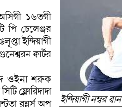
ইন্দিয়াগী নম্বর বান টেমিস সিঙ্গলস শাররায় ঙনেশ্বরন