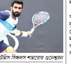
ইন্দিয়াগী নম্বর বান টেমিস সিঙ্গলস শাররায় ঙনেশ্বরন