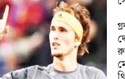
জর্মনিগী অলেকজেন্দর ছেৱেব

বেলজিয়মগী মায়কৈদগী পাক্কুনা ২ চনবা ঙমখিবা লুকাকুনা বোল কাওখিবা