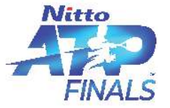
লন্দন, নবেম্বর ১৯ (এজেলী): ইংলেদন্দনা যুধু ওইরগা পাঙ-থোক্কা নুপাগী টেমিস শাররায়-শিংগী ওইবা সিজন লোইশিল্লকপগী এ টি পি ফাইনেলসকী শাররায় নিপানগী লগ্নাদা রসিয়াগী দানিল মেদবেদেব সেমীফাইনেল য়োবা ঙমত্ৰে। জর্মনিগী অলেকজেন্দর ছেৱেব সেমীফাইনেল য়োবগী তাঞ্জা ফংলি।

পনবা য়াবদি, মঙাশুবা রাউন্ড লোইশিল্লকপা ফাওবদা বেলজিয়ম পোইন্ট ১২ ফংখি। অদুনা দেনমার্কনা পোইন্ট ১০ ফংখি। মেটচ অদুনা দেনমার্কনা থোইবদা মথায় সেমীফাইনেল য়োবগী খুদোচাচা লৈৱলখি। অদুৱ মেটচ অদু বেলজিয়ম খুদম চনবা ঙমখিবা বেলজিয়ম পাক্কুনা ৪-২ দা থোইখি সেমীফাইনেল য়োবি।