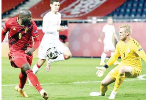
বেলজিয়মগী মায়কৈদগী পাক্কুনা ২ চনবা ঙমখিবা লুকাকুনা বোল কাওখিবা

সরায়ো, নবেম্বর ১৯ (এজেলী): যুরোপিয়ন নেসল লীগ ফুটবল টুর্নামেন্টকী অনিশুবা এদিসনগী ওইনা ঙরায় অথংবদা শামখিবা গ্রুপ এ (১) গী মেটচ অমদা ইটালিনা বোলিয়া এন্ড হর্জিগোবিনা মায়খিবা পীখিবা অমসুং গ্রুপ এ (২) দা বেলজিয়মনা দেনমার্ক পু থোইবিনা মায় পাক পা ঙমখিবা টিম অনীমক টুর্নামেন্ট অসিগী সেমীফাইনেল য়োবা ঙমত্ৰে।