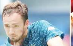
রসিয়াগী দানিল মেদবেদেব