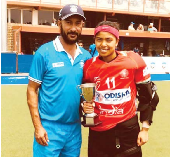
পি) লৈদুনা মশক থোক্কো শান্নারক্কি। খরিবম বিচুসু ভোপাল স্পোর্টস একাদমিদি ইন্টেনেসনল থাক য়োরকখিবা শান্নারায়নি।

ওইবা টুর্নামেন্ট অদুনা ইন্দিয়ানা সনগী মেদলস পুরগা লাকখি। হোক্কি হায়বা মশান্না অসিদিদি মণিপূরগী নুপা অমদি নুপী শান্নারায় কয়া ইন্টেনেসনল থাক্তা মায় পাঙ্ক ১ শান্না ওইহা নতুনা ইন্দিয়াগী ওইনস লমদম অসি হোক্কিদিদি হোয়া শকখওনিরি। হোক্কি চহী খরা অসিদা, হোক্কিগী ওইনা প্লেয়র পুথোকপা মশিং খরা হজ্জরগসু চহী খুদিংগী ওইনা অমম/অনাদি অদুমক হোক্কিজকু ইন্দিয়া টিমদা যাওবা উল্লি। মসিমক্কা হোক্কি হায়বা মশান্না পুরা শিখরি হায়বা তাক্কি।