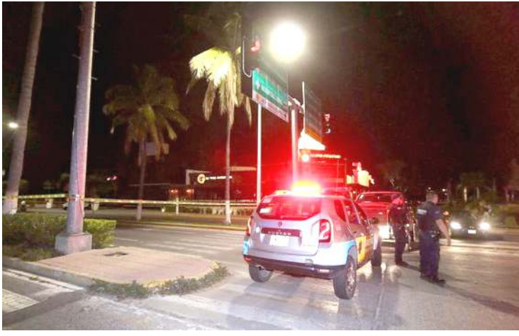
ওইবা মওন্দা মী হাংগ্ৰিগী থৌদোক ৩৪,৬৭০ থোকখি।

মেজিক্স, দিসেম্বৰ ১৯ (এজেন্সী) : মেক্সিকোগী বালিস্কো ষ্টেটকী হানগী গভৰ্ণৰ ইৰাই নুমিতা সমুদ্র মপানগী টাউন জালিস্কোতা লৈবা রেটেইৰেণ্ট অমগী বাথৰুমদা নোংমেনা কাপ্পা হাংগ্ৰে। থৌকো অসি মেক্সিকোনা কুমজা ২০০৬ তা 'ৱাৰ ওন ব্ৰগস' হৌখিবদগী চখৰকথিবা হায় প্রোফাইল পোলিটিকেল মীহাংগ্ৰিগী মনুংদা অসনি হায়রি।