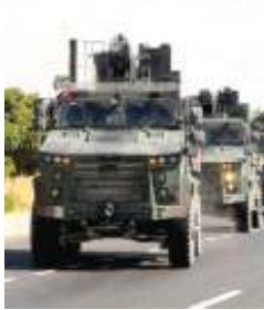
অঙ্কৰা, দিসেম্বৰ ১৯ (এজেন্সী) : টৰ্কীনা সিরিয়ান গভৰ্ণমেণ্টনা কন্ট্ৰোল তৌবা সিরিয়গী অৰাং নোংচপ থংবা লমদমদা লৈৰিবা মিলিটৰি ওভ্ৰাৰ্চেসন পোষ্ট তৰেং মফম হাংগ্ৰিগা লায়ননা ক্ৰপশিং লৌথোক্কা লালহৌবিশিং অমসুং টৰ্কীনা শৌগংপা ৰেবেলশিংদা কন্ট্ৰোল তৌবা মফ মশিংদা হোংজিনহলে হায়না ইৰাই নুমিতা টৰ্কীস সোচ্চ অমদা ফোঙদোকখি।

নুমিৎকী অহিৎদা মপুং ফানা লৌশিনখি। ফেসশিং অদু ৰশিয়গা য়ান্না অমগী মখাদা অনকাৱানা শৌগংপা ফেসশিংদা কন্ট্ৰোল তৌবা মফমশিংদা নৌনা অমক্ৰ দিপ্লোয় তৌৱি। মসিদা ক্ৰপশিং লৌথোকপা নত্ৰগা মখোয়গী মশীং হুইনবগী ৰাফম লৈতে। মখোয়গী মফম হোংদোকপগী ৰাফমতৰনি হায়না সোচ্চ অদুদা ফোঙদোকখি। সিনিয়ৰ ৰেবেলশিংগী মতুং ইয়া, টৰ্কীনা সিরিয়গী অৰাং নোংচপ থংবা শৰক্তা ক্ৰপ ১০,০০০ অমসুং ১৫,০০০ গী মৰক্তা থঞ্জি। ক্ৰপশিং অসি থুয়াগা লায়ননা লৈবাক অসিনা ৰেবেল ফাইটৰিং অমসুং হায়া কন্ট্ৰোল তৌৱি হায়খিবা থিহিদ্ৰিষ্ট ফেসশিংসু মতেং পাংলি।