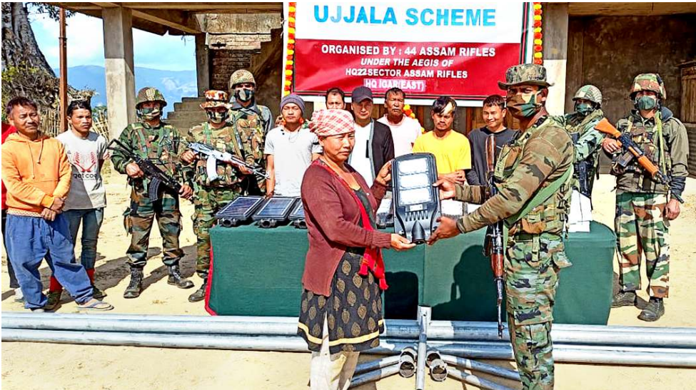
৪৪শুবা অসাম ৱাইফলসনা তৌসেম সব-দিভিজনগী মনুং হঞ্জিনবা অবেন ভিলেজকী লম্বীশিংদা ইলটোল তৌনবা সোলৰ ষ্ট্ৰিট লাইটিং খুংশিন্নখিবা

চমা লৈবা জৱাই হায়বা মফম অদুনা থোকখিবা খংন-নৈনবদী থৌদোক অমদা ইৱাননি লুইট কৌবা মীওই অমা হাংপদা চুলেট অমসং কোমিং ৱেবোন কৌবা মীওই অনী অসি মৱাল লৈৱে হায়না জৱাই দিষ্টিক্ট এদ সেনস কোৰ্টনা লাউথোকপ্ৰে। আই পি সীগী সেক্সন ৩০২গী মখাদা চুলেটপু পুন্নি চুপ্তগী ফাদোক পীখিবনি।