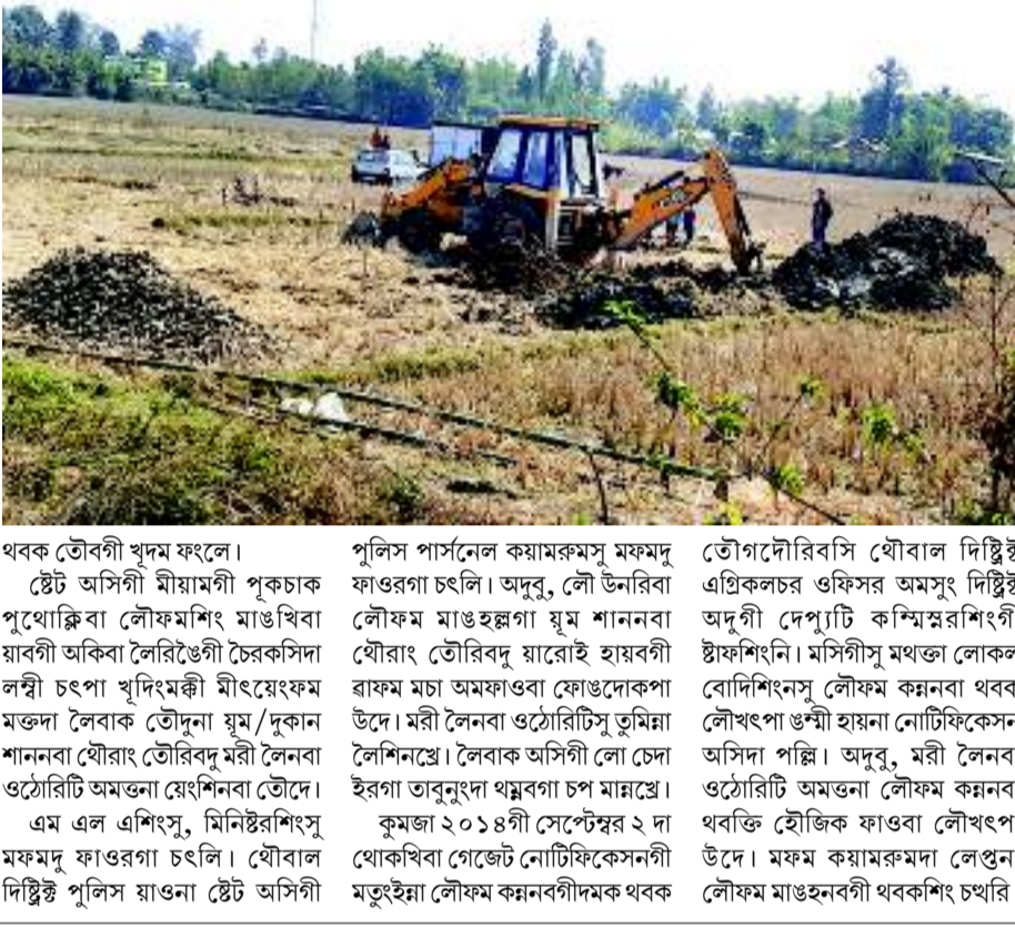
লৌফমদা য়ুম শানবা থৌৱাং তৌরে

ইম্ফাল, ফেব্রুৱাৰি ২০ (এচএনএস): উচি চাকহোন্দা বাইথৌ ৰিজৰ্ব ফোৱেষ্ট এয়ায়াদী চীংগেলবাক কোং-খিবদগী চীংজুট কয়ামৰুম তুমখিবগী ৰাথোক লোইনজিঙেদা লৌফম শোকপা য়াৱেই হায়বা লৈঙাক্কী লো লৈনা-লৈনা থওই-রাওইদনা মীওই খৰনা তাংজেং ময়গী লোকোলদা য়ুম শাজিমা যৌৱাং তৌৱা হৌয়ে।