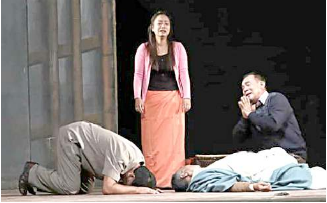
অকংবা উপালগী সিন অমা

খা-মণিপুর দ্রামা ফেষ্টিবেল - মণিপুরৰ পাণ্ডাখোকাৰ দ্রামা-ফেষ্টিবেল খৰ সিন্ধী মনুন্দা য়াঙ্গা মৰু ওইবা অমা ওইনা লৌনৰুৱে। মতম অমা মণিপুরী খা-মায়কৈ লৈবা দ্রামা লুপ খৰখন্তী ওইবা দ্রামা-ফাংনবকী কুম্হৈ ওইবনী হায়বদি মমিংশিন্দুৰ অদুম ময়েক শেংনা তাকচৈ। ১৯৫৫, মেৰা খাখী থানিল নুমিংতা শৰুফোঙলকখিবা 'লাংমৈদেং দ্রামাটিক যুনিয়ন' না মৰু ওইবা খৌদা লৌন্দনা খৌবু ওইনা পাণ্ডাখোকাৰ। মতম অমা মণিপুরী আট এন্ড কলচৰ দিপাৰ্টমেণ্ট'না শেলগী মত্বে পীন্দুনা কো-স্পোন্সৰ ওইবীৰুদু তোকখিবদনী 'মণিপুর ষ্টেট কলা একাডেমি' না আহাঙবদু মেনশিনবীন্দনা, মতম অসুৰ কুইশিং ফেষ্টিবেল অসি পূৰ্ণা শীমমিদানুনা লাকপনি। অদুব, ফেষ্টিবেল অসিগী ৪৪শতাব্দী পদ্পদু অসিদদি 'একাডেমী শেল লেট্ৰে' হায়দুনা এল দি যু মখন্তনা শীঞ্জবা ফেষ্টিবেল অমা ওইহুয়ে। থিয়েটৰ সোণৰ মণিপুরী শীৰবা 'সোটে-প্লে কম্পিটিসন' অমসুং শুমাং-লীলা কাউন্সিলগা শীমমিদনা 'শুমাং লীলা ফেষ্টিবেল'দীসু মণিপুর ষ্টেট কলা একাডেমী খৌদা কোমথোকখিদনা, একাডেমি অসিগী 'কলচৰেল ৰেপ্ৰেজেন্টিবিলিটি'না অচৌবা ৰাহং অমা হংনীংওই ওইবা তানফম অমা লাকহুয়ে। লাকদবা কোৰৌশিংদা, মণিপুরী কলচৰগা মৰী লৈনবা থবক/খৌৱমশিংদা মণিপুর ষ্টেট কলা একাডেমি'না লৌৱকদবা খৌদাংশিংদা জিনবা অমা পোকহুয়ে।