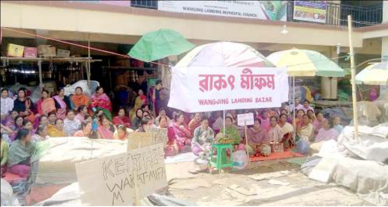
রাংজিং মুনিসিপাল কাউন্সিলনা কৈথেল ফন্থীশিংদী টেক্স হোমো লৌবগী মায়েজা ইমা-ইবেনশিংনা রাংজিং কৈথেলদা বাকং মীফম ফম্বা