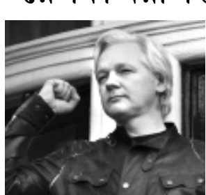
লন্দন, মে ২০ : বিকিলিক্কী ফাউন্ডৰ জুলিয়ন অশাঞ্জগী মথক্তা চ্চী তরেং চ্চুয়া শিৰকথিবা রেপকী মরাল অশাঞ্জগী প্ৰোসিকুটৰশিংনা লৌখোক্ৰে, তৌইগুশ্বুং মহাক্ৰা মহাকী তুংগী পুশিগা মৰী লেননা শৌক্ৰগদবা মতিক চাবা অচুয়া লাল অদুদি হৌবদা গুইরি হায়না ফোঙদোক্ৰে।

এলিগেচন অদু হন্দোকথিবা মতুংদা অশাঞ্জগী লন্দনদা লৈবা একাদৰগী এয়েসিগী বেলকোনিনা নুশা মঙাল মরক্তা থোক্তা হুৰাউ অয়াস্কা উংখি। তৌইগুশ্বুং মহাক্ৰা মহাকী লম্বী লৌহিগদা য়ান্ৰা বাংলি হায়খি। মহাক্ৰা এয়েসি অদুনা কুমজা ২০১২ দগী চঙক্ৰম লৌনা মপানদা খোক্তা লৈৰকথিবনি। অশাঞ্জগী মহাক্ৰা এয়েসিডু থাদোক্ৰা চংক্ৰা হায়বগী মতাংদা কৰিমতা ফোঙদোক্ৰে।