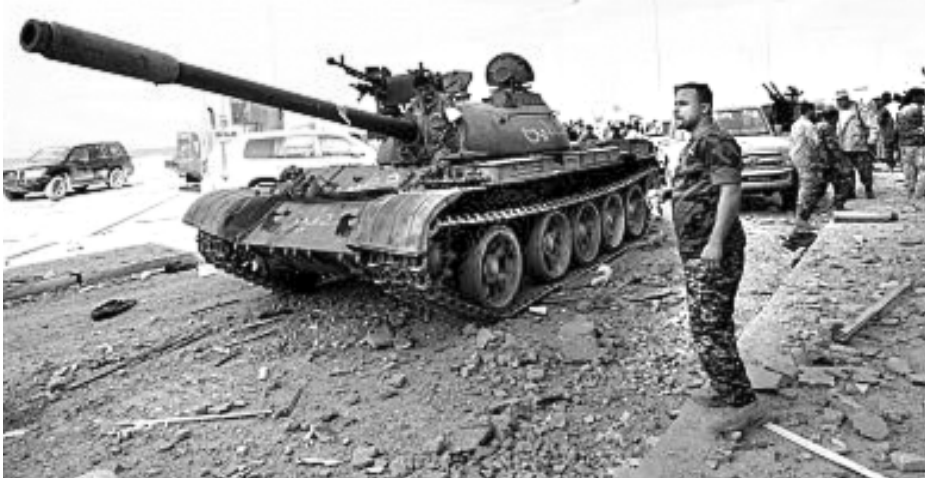
১০৩দিএলএনএগী ক্ৰেশিংনি। মথোয় অয়াস্কা মফম অদুনা লেবা ১২শুবা বুগোদকীনি। মথোয় থাৰ্দ ফোৰ্চেস হায়না খঙনবা বেটন সিটি মিশ্ৰাটাদকী বুগেদে অমদা এটেক তৌখি।

বেঙ্গজি, লিবিয়া, মে ২০ : সাউদৰ্ন লিবিয়াগী এয়ৰবেজ অমদা চখাখিবা এটেক অমদা য়ামদ্রবদা মীওই ১৪১ শিখ্ৰে হায়না ইষ্ট লিবিয়ন আৰ্ম ফোৰ্চেসনা ইয়াই নুমিঙতা ফোঙদোক্ৰে। থৌদোক অদুগা মৰী লেননা য়ুনাইটেদ নেসপনা শৌগংপা লিবিয়াগী গৰ্ভমেণ্টকী মকেক্ৰা মহাকী দিফেন্স মিনিষ্টৰত যৌদোক অদুগী মতাংদা ইনভেষ্টিগেচন চখাখিগৈগী ওইনা সসপেন্দ তৌখ্ৰে।