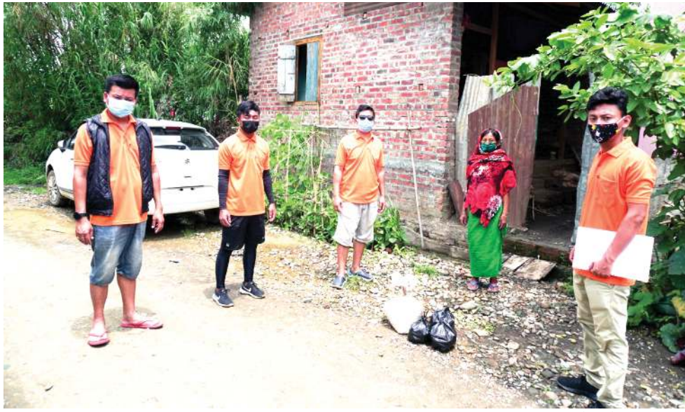
কোভিড-১৯ গী অনীৰকশুবা ৰোভনা মৰম ওইয়গা হৌবাল ময়াই লৈৱক মথাজ লৈবা অদৌবা মঙাল যুথ ৰুৱনা কোনবা কন্টেনমেন্ট জোন লাউথোকৰবা মফশিংদা ৰুৱ অসিগী হৌমীশিংনা চানা থৰুবা পোংলমশিং ত্ৰেংবাথিবা