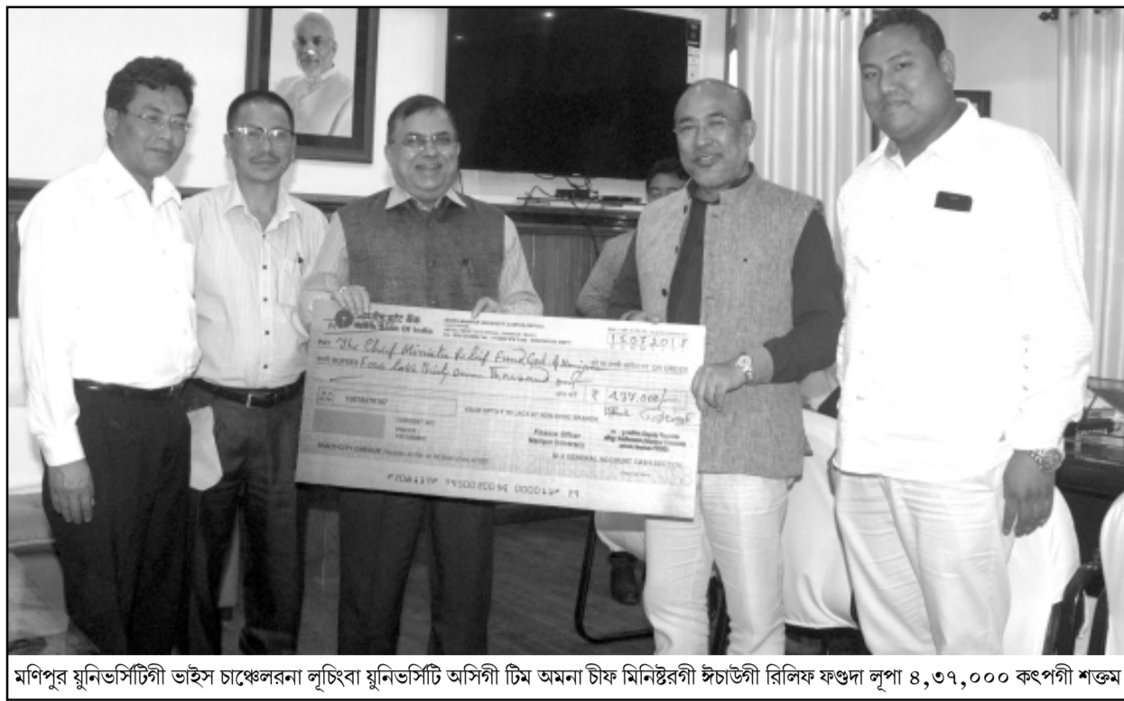
মণিপুর যুনিভার্সিটিৰ ডাইনেচিয়েল চাঞ্চেলরনা লুইচা যুনিভার্সিটি অসিগী টিম অমনা চীফ মিনিষ্টাৰগী ঈচাউটী বিলিফ ফণ্ডা লুপা ৪,৩৭,০০০ কংপনী শতম