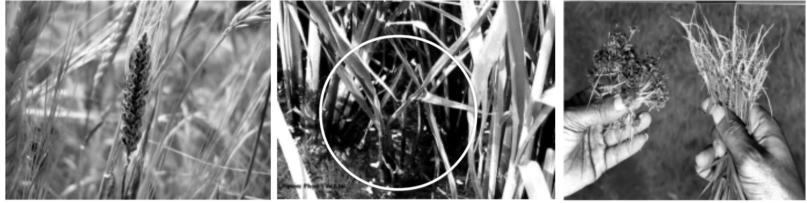
Black smut or bunt, Grassy stunt, Root knot nematode

মালেমগী ওইনা ফৌদা তাবা লায়না ৯৫ মুক অমসুং তীলনা মখল ৯৫০ মুক লৈ হায়না পানৈ। অদুম ওইনমক মফম অমুক্তা পূনা তাবদি নক্তে; লম, লৌফম অমসুং কুম খেলবগী মতুংইনা লায়না তীলনা তাবগী চাং খেই। মণিপূরগী লৌফমশিংদা তারিবা লায়না তীলনা চহী খুইদগী খেই, অকন কন্দা মাল্লদে। কুম অমদা য়ান্না কনবা লায়না নংত্রগা তীলনা অমা, কুম অমদা য়ান্না শোনবা নংত্রগা মশক ফাওবা উদবা যাই। মশক উরমদবা লায়না নংত্রগা তীলনা চহী অমদা য়ান্না কনবা য়াওই। অদুবু চহী খুইদগা লায়না তীলনা মখল ১৫-২০ ফাওবদি শোয়দনা খেংনরে। লায়না তীলনা খরা অসিগী মনুংদসু খরা অমদি চহী খুইদগী খেংনরি।