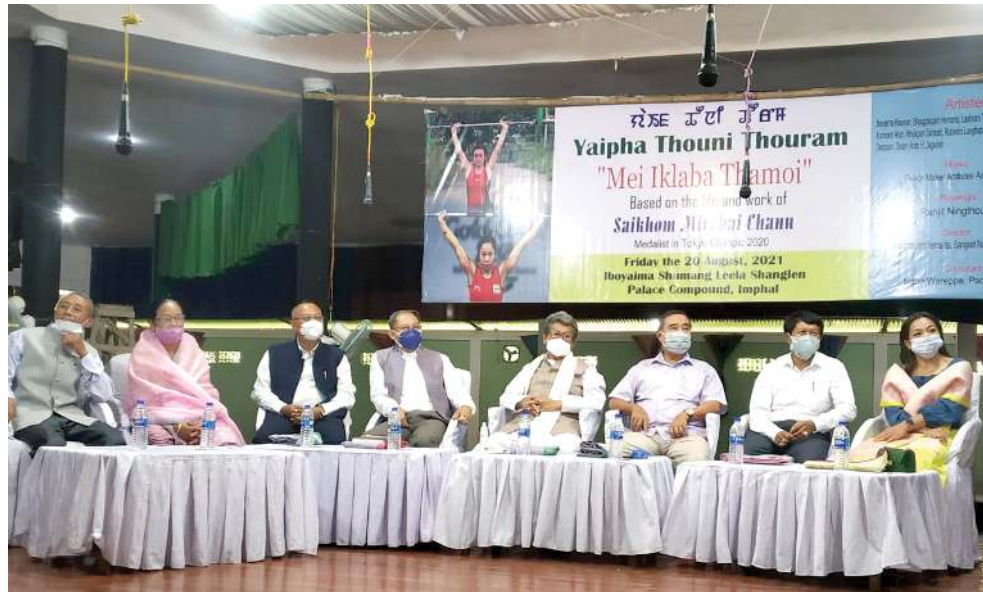
পেলেস কম্পাউন্ড ইফ্ৰালদা লৈবা ইবোয়াইমা শুমাং লীলা শঙলেনদা পাঙথোকবিবা ওলিম্পিক মেদালিষ্ট সাইখোম মিরাবাই চমুগী পুসি অমদি খবকা যুষ্ফম ওইবা অখনবা শুমাং লীলা 'মে ইক্লাবা থামোয়' গী ষ্টাৰং যৌনি যৌৱমদা শৰুক য়াখিবশিং

ষ্টেট অসিদা কোভিড-১৯ লায়না লাইচং শব্দেদাপগী চাং হায়নাগা য়েংনখিবনা হস্থবৰুৱাসু মীয়ায়না য়ায়া চেকশিনবা মথৌ তাৰি। কৱিগুমা মীয়ায়না চেকশিনহৌদৰদি লায়না লাইচং অসিদা অমুক হুমা মীওইবদা অকনবা চেংথেং পীবগা লায়ননা মীশি মীনা থোকহলুৱকা য়ানা লৈ। মৰম অসিদা ষ্টেট অসিদা লায়না লাইচং অসি মপুং ফানা মুখংত্ৰিবা ফাওবা মীপুং খুদিংমত্ৰে লেঙাৰু শেমখিবা চংনা কাঙলোনশিং গুমা চংনবা আপীল তৌৱিকি।