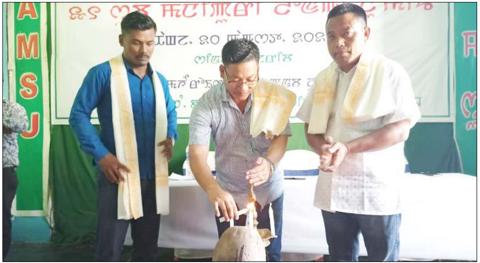
ওল মণিপুৰ ষ্টুডেন্টস যুনিয়ননা শীলুনা দি এম যুনিভাৰ্চিটি কম্পেন্সদা লৈবা যুনিয়ন অসিগী হেদ কাৰ্টৱা পাঙথোকখিবা ৩১ শুবা মণিপুৰী লোদগী নুমিং যৌৱম

অসিদা লেমহৌৰিবা চয়েংনবগী মফম ৬ অদুগী মতাংদা বারোইশিন পুৰুল্লগা ৰিজনেল কমিটিশিং শেমদুনা য়েংশিনহনবগী মতাংদা খন্নগনি। স্টেট অসিদা লৈরিবা মেঘালয়া দেমোকেটিক এল্লাইল গভৰ্ণমেণ্টকী অমতা গুইৰবা পাৰ্ দমদি চয়েংনদুনা লৈরিবা ওমখৈগী ৰাথোকশিং অসিগী বারোইশিন অমা পুৰুল্লগা হোংনবনি। হৌখিবা মাৰ্চ থানা চয়েংনবা কয়া লৈৰহুদগী ৰাশিন্গা পুৰন্তু না ৰাথোক লোইশিনশ্ৰিবা মফম ৬ অদুদি ত্ৰাবাৰি (৪.৬৯ স্কাৰ কিমি), গিজিং (১৩.৫৩ স্কাৰ কিমি), হাইম (৩.৫১ স্কাৰ কিমি), বোক্তাপাৰা (১.৫৭ স্কাৰ কিমি), খলাপাৰা-পিলিকাতা (২.২৯ স্কাৰ কিমি) অমসুং ৰতাচোৱা (১১.২০ স্কাৰ কিমি) নি হায়রি।