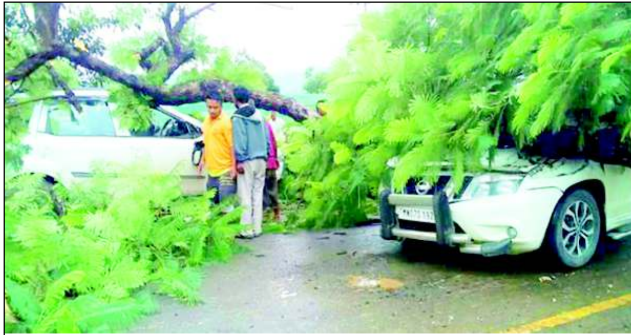
ইম্ফাল ইষ্ট ডিষ্ট্রিক্টকী মনুং চ্চা লৈবা চাংগুৱেল তেজপুৰগী ফকুংগী লম্বী মপালদা হৌবা অচৌবা গুলমোহোৱৰ পান্ধী অমা তেংকথৰকুনা গাড়ী ননশিনবা