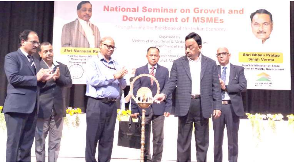
মিনিষ্ট্রি ওফ এম এস এম ঈনা শিন্দুনা পেলেস কম্পাউন্ডদা লৈবা সীট কনভেন্সন সেন্টরদা পাঙথোকখিবা নেসনল সেমিনার মেরা চুদুনা হৌদোকপা

য়াবগী ওইথোকখিশিং লৈরি হায়না ওফিসল ওইবা রিপোর্টশিংনা হায়রি। পনবা য়াবদি, ত্রিপুরা হায় কোটনা ওজাশিং অসি লৌবগী থবক অশোয়া কয়া য়াওখি হায়না ফোঙদোকখি ওজাশিং অসিবু থবক্তগী টরমিনেট তৌথিবগী খুদজ ওজাশিং টরমিনেট তৌথিবগী হৌওং অদুনা মরম ওইরগা থবক লৌথোকপদা য়াওখিবা ওজা মতুং মনাত্তা ওজাশিংগা য়াওখি থোকখিবনি।