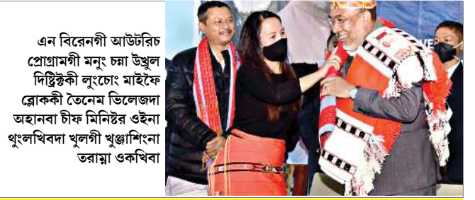
এন বিরেনগী আউটরিচ প্রোগ্রামগী মনু চমা উখুল দিষ্টিক্কী লুংচোং মাইফৈ ব্রোক্কী তৈনেম ভিলেজদা অহানবা চীফ মিনিষ্টর ওইনা খুংলখিবা খুলগী খুঞ্জাশিংনা তরান্না ওকখিবা

প্রোগ্রেসিভ রাইটস এসোসিয়েশনগী মনা ও লায়েক্লগানি লামায় ৩ দিরেক্টর হাঙ্গিদবনা এদুকেসনদা চাওনা অপনবা পীরে : কিমাক্স লামায় ৫ চীনগী লমজেল তামবগী মহুতা খুংকী লমজেল ওইনা তামসি : কেবী লামায় ৬ যু এসতা ডিজিট তৌবদা মতম খরগী ওইনা অখিবা থমগদৌরি লামায় ৮