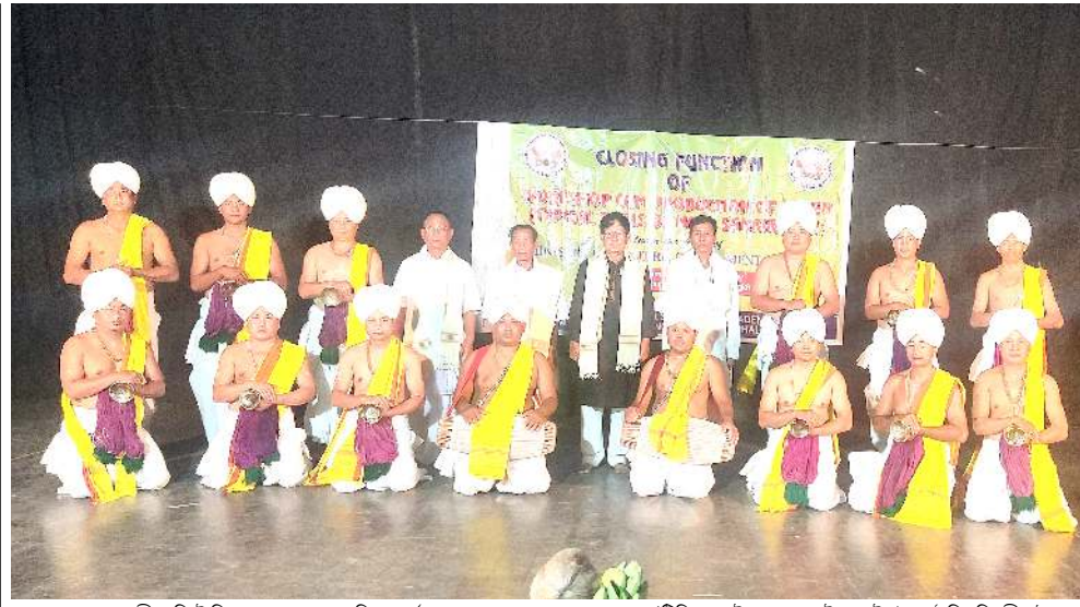
থা অমা চুপা পালগী ওদিটোৱিয়মদা চখুদনা লাকখিবা ৰাৰ্কশোপ কম প্রদৰ্শন ওফ ১২ মেন (চিপিকেল টালস ওফ নট সংকটন) লোইশিনবিগী য়োৱম

শেলগী তেংবাং পীবিগী য়োৱম অদুগা মৰী লৈননা চীফ মিনিষ্টর হিমন্তা বিশ্ব সর্মনা ফোঙদোকখিবা, ষ্টেট অসিদা লৈরিবা বি জে পিনা লুচিংবা লৈঙাক অসিদা লমদম