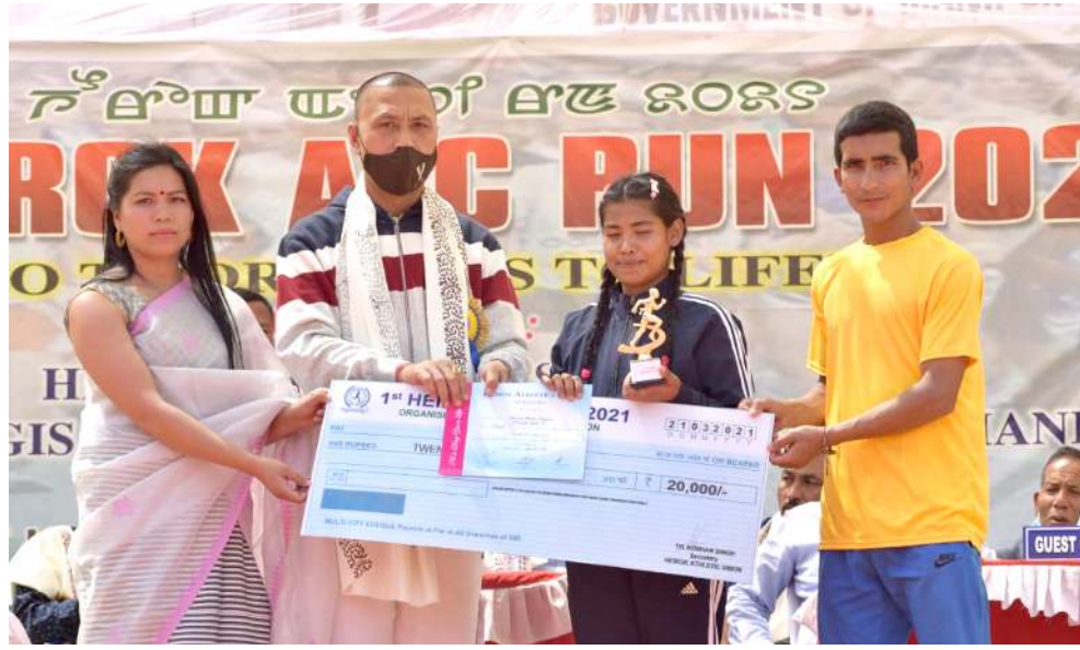
এইখোয় ময়ই কবা চিঞ্জাৰী লাপনা লেৱসি হায়বগী পান্দমা অহনবা হেৰোকৰন ২০২১ দা শৰুক হায়িবি নুপীমাচা অমদ মেমেস্তো অমদি শেলগী মনা দীখিবা

কোভিড-১৯ পোজিটিভ ওইরল্লে হায়িৰা অমগী অমগী মত্ৰুদা নিওগ মমাং চহীগী ওগষ্ট থাদসু কোভিড-১৯ পোজিটিভ ওইরল্লে হায়ি।