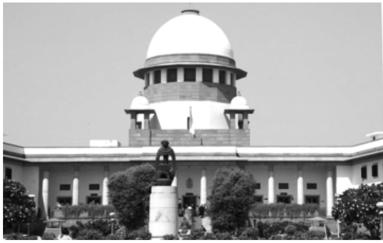
কোলকটী হায় কোর্টনা থাগী খুদিংগী খায়নখৰী মহাকী লায়নবীদা লুপা ২৩,০০০ পীনবা য়াথং পীরকপৰা মতুংদা মীওই অদুনা কোর্টকী ৰায়েল শীংনরদুনা সুপ্রিম কোর্টতা ৰাক্‌খি।

ন্যু দিল্লি, এপ্রিল ২১ (এজেন্সী) : মপুৰোইনা খায়নখৰী মহাকী লায়নবীদা এলিমোনি ওইনা থাগী তোলোপকী চাদা ২৫ পীগদবনি হায়না সুপ্রিম কোর্টনা ফোঙদোকপ্তে।