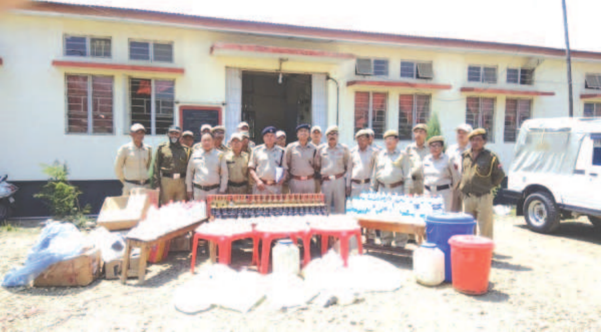
১৭ শ্ববা লোক সভা মীখলগা মরী লেননা যৌবাল দিষ্টিক্তি অমসুং ককচিং দিষ্টিক্তি তৌগন-তৌগননা মফমশিংদগী ফাগলকবিবা যুশিং যৌবালগী এল্লাসাইজ ওফিস, যাইরিপোক এল্লাসাইজ ওফিস অমসুং ককচিং এল্লাসাইজ ওফিস মমাঙশিংদা মে থাদুনা মীয়াম মমাঙদা মাঙনবগী শক্তম