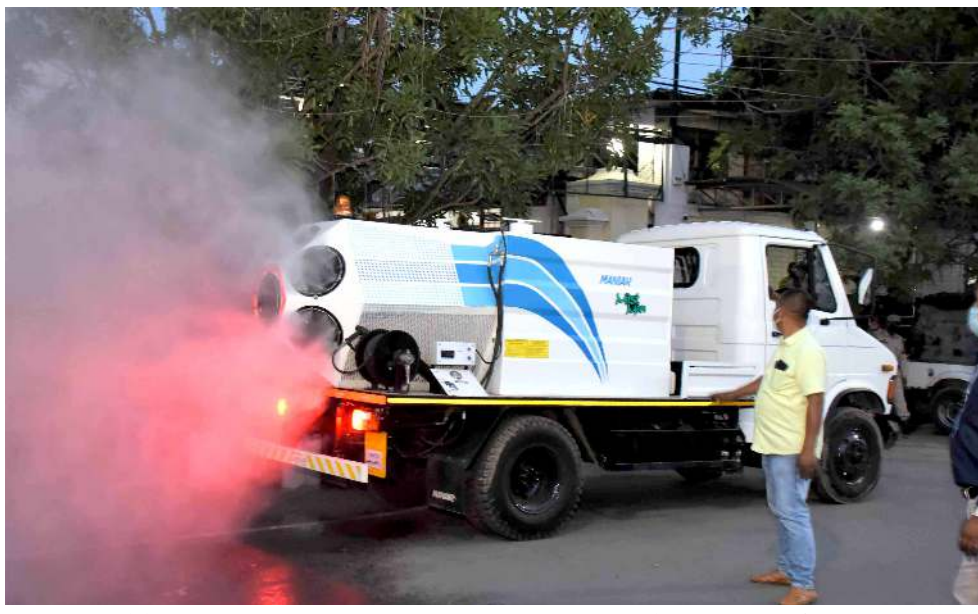
মণিপুৰগী চীফ মিনিষ্টাৰ নোংথোহুম বিৱেননা ইশ্ফল মুনিসিপাল কোৰ্পোৰেচন (আই এম সী) দা খুংশিল্লকপা সেনিটাইজাৰ ডেইকল

মপানদী গেষ্ট্ৰিশিং নুমিদাং পুং ৬ ফাওবা চাবা থকপা য়াহনগনি অমসুং হায়দগী হোটেল মনুংদা লৈবাকপোকপা গেষ্ট্ৰিশিংদি মহৌশাগী মতম চংনগনি।