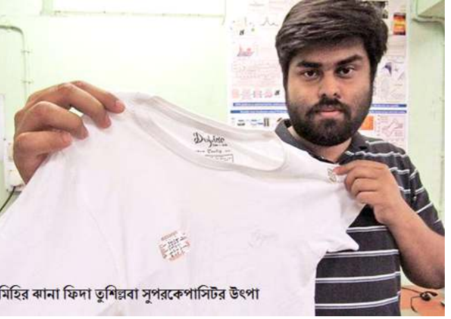
মিহির বানা ফিদা তুশিনবা সুপারকেপাসিটর উৎপা

হৌজিক ফাওবগী বারীদা কনি হায়বা মী অহম হোমো লৈ। কাগদবদি অমখর্জন। কননা অশেংবা ওইনা কাগদগে হায়বা অদুদি খঙদি।