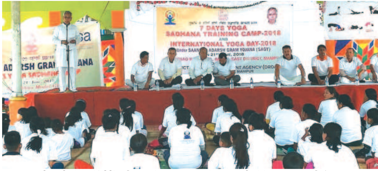
দি আর দি এ ইম্ফাল ইষ্ট দিষ্ট্ৰিক্টনা শীন্দুনা পুখাউ মোদেল গ্রাম পঞ্চায়তটা পাঙথোকখিবা ইন্টরনেশনাল যোগ দেগী যৌরম