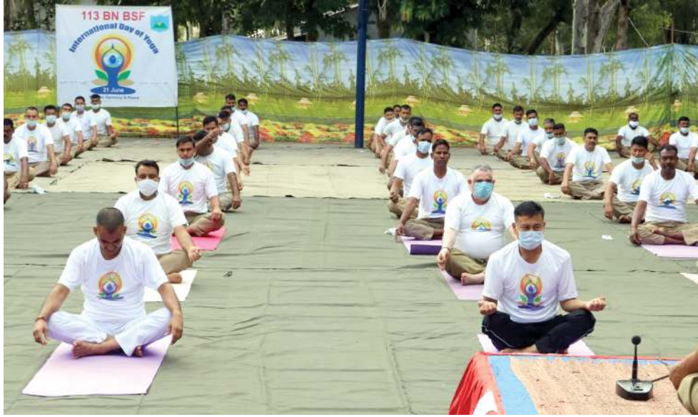
মিনিষ্ট্ৰি ওফ অয়ুশনা ফোণ্ডবা কোভিড-১৯ গাইদ লাইবকী মত্ৰু ইয়া ১১৩ বটালিয়ন বোৱেৰ্ৰ সেকুৱিটি ফোৰ্চ (বি এছ এফ) হেদ কাৰ্টসৰনা শীন্দুনা তোঙান তোঙানবা সী আই পোষ্টশিংদা ইন্তৰনেশনেল যোগা দে পাণ্ডথোকথিবগী শত্ৰুম

থবক অমা ওইনা লৌৱি। মীয়ামগী হাইফনবা তৌবগী মছত্ৰা পাৰ্টিগী কামবা থক য়েংলগা থবক তৌৱিবা অসি লাইবকথিবনি। অসামাদা মীয়ামগী কোভিড পেপ দমিক মৱজা খুদোংচাদবা কয়া মায়োৰ্গ ৰিবা অসি মতৌ কৰ্ম্মা কোকৰনগদগে হায়বদা কোক থাদবগী মছত্ৰা অতোগ্ৰা পাৰ্টিশিংবু হুদুনা ভাঙলি। ওপোজি সন পাৰ্টিশিংগী অশোয়বা থিৱগা থবক তৌনবা মতম ওইৰিবা অদুগ্ৰা মীয়ামগী শোথৰবা হীৱমশিং কয়া খঙদেৱগা মদু মেনখনবা থবক তৌৱৰুৱবদি ওপোজিসনদা লৈৱবসু বি জে পি মনীং তন্না থাংগপা ফোণ্ডদেৱগদবনি।