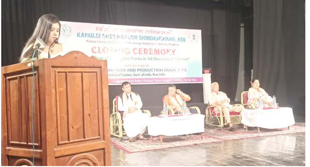
কংলৈ শৈশক্ৰোণ শিন্দামশংনা শিন্দুনা জে এন এম দি এদা পাঙথোকথিবা কলচৱেল টুৱ গুফ খোঙজোম পৰ্ব ইন টেন দিষ্টিক্টস গুফ মণিপুৰ লৌহশিনবগী যৌৱম

কুমজা ২০২৪ দা পাঙথোক্কদৌৱিৰা লোক সভা মীখলদা আরবিন্দ কেজিৰালগী অচৌবা ৰেব অমা শোয়দনা লাক্কনি হায়বাসি বি জে পিনা খঙবদগী দিল্লীৰী লৈগাকপু থুগায়নবা তাক্কক কয়্যৱজা হোংনদুনা লাক্কি। অদুব দিল্লীৰা লৈৱিৰা মীয়ায়্মা কেজিৰালগী লৈগাক অসিবু পান্দুদগী সেন্টেৰনা থুগায়নবা হোংনৱবসু মায় পাকপা গুমননি। দিল্লীৰী ওইনা লৈৱিৰা এদুকেন্স, ট্ৰান্সপোৰ্ট অমদি হেল্থ সেক্টৰিংদা মাজিল থানা চাওখঙলক্কিৰা অসি কেজিৰাল লৈগাক থুগা হোংনা শেংনা থবক তৌবননি হায়বাসি মীয়ায়্মা খঙই। দিল্লীৰী মীয়ায়্মা নতুনা লৈবাক অসিগী মীয়ায়্মা কেজিৰাল গুহ্মা মীয়ায়্মা খনবা অফবা লুচিবু অমা পান্দী। মসি খঙবদগী বি জে পি মীয়ায়্মা হৌৱকথিবনি হায়ৰি।