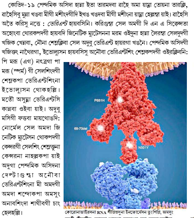
কোরোনাভাইরসনা RNA শীজিন্দুনা ইনফেকশেন চুংগিগি, অমসুং মদুগী জিনেটিক কোডতা থোকপা অহোংবা মচা অমনা অনৌবা ইইনফেকশি শেমকই

কোভিড-১৯ পেঙ্গমিক অসিদা হাম্মা ইতা তারমদবা রাইহে অমা য়ায়া তেয়না তারক্ৰি, রাইহেসিবু মুয়া খঙবা মীগী মশীংদগীদি ইখঙ খঙদবা মীগী মশীংনা য়ায়া হেল্লহায়া ইহা।