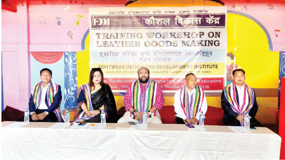
খৌবালা লেশাংখেমদা পাঙথোকখিবা লেদর গুদস মেকিং ট্রেনিং প্রোগ্রাম হৌদোকপগী খৌরমদা মরুওইবা মীওইশিং ওইনা শরুক য়াখিখিংশ