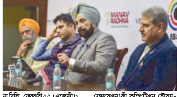
নুইদু, ফেব্রুৱারী ২২ (এজেন্সী): ইন্দিয়ান য়ুথ ওইদনা থা অসিগী ২১দগী হৌখিবা আইএসএসএফ (ই টরনেশনেল শুট্টিং স্পোর্টস