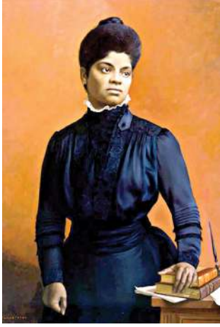
মহাক্কী মচিন-মনাওশিং য়েংখিনখি। মরকসিদা মহাক্কী কালেক্টা মনুংদা কোলেজ কোসিং তমশিনখি অমসুং লোকল জনেল অমনা ইদা হৌখি। নোংমা মহাক্কী ফষ্ট টিকেট লৈরগা ত্রেন তোংলিঙেদা কম্পিউটার অদুনা মহাক্কী অপোকপা অমসুং অপোকপী অনীমক য়েলে ফিভরনা নাদুনা শিখি। ইমুংগী মত্ৰে পাংনবিদমক্কা মহাক্কী ওজা ওইখি। অসুয়া

ফতবা তৌবনি হায়বা মীওইবু অচুম অরান খীদনা নংত্রগা রায়েল তৌদনা খুদক্তা ময়াম চঙুনা হাংপা (লিফিং) গী মায়োক্তা কেস্পোনা তৌখিবি জনেলিষ্ট সিভিল রাইটস অমসুং ব্রিটিশ এলিভিষ্ট ইদা বি রেলস স্টেশনগী চংনবি লৈরিঙে কুমজা ১৮৬২গী জুলাই ১৬তা হোলি স্পিৎস মিসিসিগ্লিদা পোকখি। মহাক্কী অপোকপা উ শুবা মীশক অমনি অমসুং অপোকপীনা কুক অমনি। মখোয় মিং বোলিং কৌবা নুপা অমনা লৌইবা মীনাইশিংনি। মখোয় মিং বোলিংনা নীংখিনা তৌখিবি অদুবু মীনাইদি অদুম ওইবগা। মখোয় মহাক্কী হায়বা খুদিংমক তৌগদনি অমসুং মখোয়গী ইমুংগী মীওই অমা মতম অমনা হেজা অতোপা মীনাই লৌইবা অমনা য়োনবা য়ায়মী। ইদা পোক্কা মত্ৰ মতম ইকুই কুইনা প্রিন্সিপেট অত্রম লিফননা ইমানসিপেসন প্রোফ্রেমেনস ইসু তৌখি। য়ুনাইটেড স্টেটসতা লেবগী হাইকবদি মসিনা ইদা অমসুং মহাক্কী ইমুংবু মনিং মখা তহানখি। অদুম ওইবগা ইদাদি মিসিসিগ্লিদা লৈরমী। সিভিল বার মত্ৰ ইদা অমসুং মহাক্কী ইমুংবু মনিং মখা তহানখি।