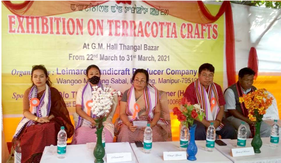
দিঙলপমেট কশিমাৰ (হেণ্ডিক্ৰাফ্ট) নু কল্লৌগী শেফ্ৰ মফাদা লৈমৱেল প্ৰদুসৰ হেণ্ডিক্ৰাফ্ট কম্পানি লিমিটেড ৰাঙু মমাং সাবলনা শীশুনা ইফ্ৰালগী জি এম হোলদা নুমিং ১০ নি চুপা চংগদবা তেৰা কোটা ক্ৰাফ্ট একজিবিজন হৌদোকপগী থৌৱমদা প্ৰসিদ্দিয় মেফ্ৰ ওইনা শৰুক য়াখিবশিং

ৱাইফলসনা লুপকতা হিদাক ওইনা শীজিন্নগা য়াৰা জিনসেং লোনা য়াদবা মওণা লক্সোৰা ইতিক তৌৱে হায়বগী অক্ৰুনা পাউ অমা ফংলবা মতুং অকোয়বগী কীঅমশিং চেকশিয়া মৌনিটাৰ ডৌনুনা লাকখিবনি। থাংজ নুমিংকী নুমিদাৰাইৱমদা মীওই অম্ভা জিনসেং কনসিট্ৰিয়েলিগী অদু কাৰ অমদা হাপ্ৰগা লাকখিবনি। চিংনিংগাই ওইবা মওণা লাকখিবা কাৰ অদুৰ এ আৰ পৰ্শ্বেলিঙনা খাম্ৰগা চেক