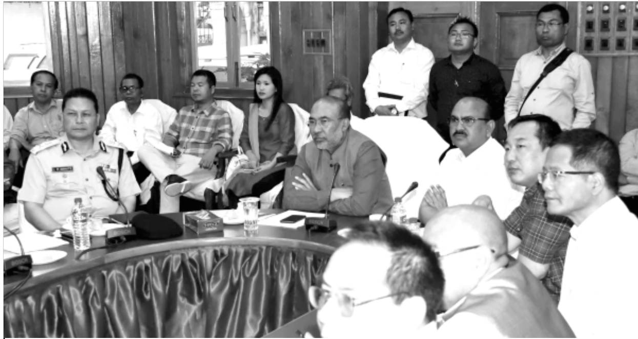
মে ১ দণী হৌগদৌরবা খুংং চংলু হায়বা খৌরাংগী মতাংদা চীফ মিনিষ্টর এন বিরেননা মকোক থোংবা ওফিসলাংগা খম-নৈনবা