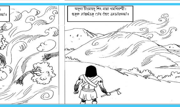
অসিজোলেং ৱেণ্টেবংখা ষ্টোৱি অমসুং আৰ্ট : সামসন সলাম চেৰ্ণাৰ ৱেণ্টেবংখা ষ্টোৱি অমসুং আৰ্ট