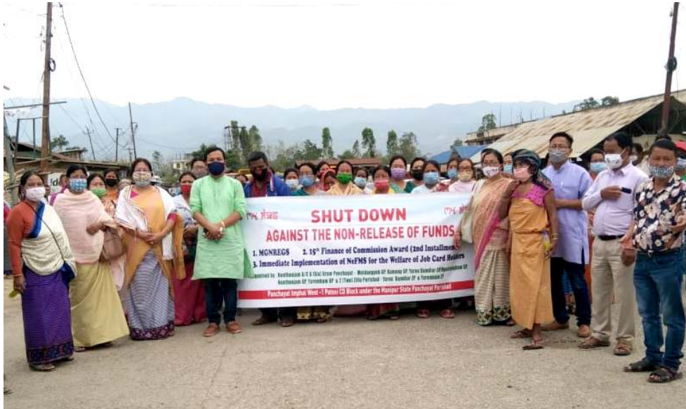
মণিপুৰ লৈবগুৰু পৰ্যায়ট ৰাজ ইন্সটিটিউশনগী ফন্দশিং থাদোক্, এম জি নৰেগগী জোব কাৰ্ড হোলদৰশিংগী খুংশুমন অমদি ১৫ শুবা ফাইনাল কাম্বিনগী সেকেন্দ ইন্সটোলেমেণ্ট পীথোক্ হায়না দিমাদ্ তৌৱদুনা খুংগে বজাৱদা গুইংবংম জিলা পৰিষদ টি এচ নিলামগীনা লুচিঁদুনা খোঙুং চঙশিনখিবা

দেবাত্ৰতা সাইকিয়াস্ শ্ৰীগোলশেন নুমিংকী নুংখিলা দিচাং ৰিসোর্টত পুথু। অদুমওইনমক মহাক্কা কোংগ্ৰেসকী লুচিংবশিং অদু গোট টুগেদৰ অমগীদমত্ৰা ৰিসোর্ট অদুনা লাক্ৰিবনি হয়।