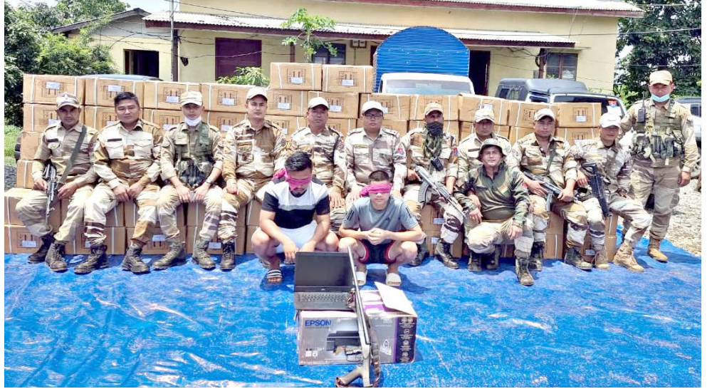
নহাকপ থোংখোঙদগী ইম্ফাল ইষ্ট দিষ্টিক্ট পুলিসনা মীওই অনীদগী কফ সেৱফ ৰোটল ১৩,৪০০ ফাগংখিবা

হেনগংহুৱাৰা অখৰা থৌৱাংশিং লৌখংখিবগী মনুং চানি হয়খি। হৌজিক ফাওবদা অসামদা এ এ পিদা যাওশিনপ্ৰে মীওইশিংগী মনুংদা তোঙান তোঙানবা নেসনল পাৰ্টিশিংদা যাওৱম্বা শঙ্কা হৈৱবা লুচিংবশিং যাওৱি। ওসি দ্বিৱগৰগী লাহোৱালদা পাণ্ডথোকখিবা থৌৱমদা বি জে পি, কোংপ্ৰেস, এ জি পি, ৰাইজোৱ দল, এ জে পিনচিংবা পাৰ্টিশিংদগী মীওই কয়া এ এ পিদা যাওশিনবনি হয়খি।