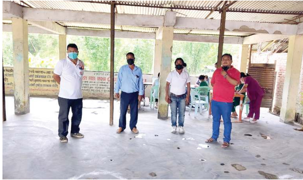
ওল মণিপুর যুনাইটেদ ক্লব ওর্গনাইজেশনগী লীচিং মখাদা লেবা ইফল রেট দিষ্টিক্ত যুনাটেদ ক্লব ওর্গনাইজেশননা ন্যু কৈথেলমানবী যুনাইটেদ ক্লবকী কম্মিউনিটি হোলদা কোভিড-১৯ গী অনীশুবা বেড অসিদগী খরনা ওইরকসু ডাকখোকপা গুন্না মাষ্ট টেষ্টিং প্রোগ্রাম পাঠখোকখিবা

অগরটোলা, জুন ২২ (এজেন্সী): ত্রিপুরা গী উনাকোটি দিষ্টিক্তকী পুলিসনা কংহল্লগা পুরকপা গঞ্জা কিলোগ্রাম ১৭৩ ফাৰা ও মখিবগা লোয়ননা গঞ্জাশিং অদুৰ পুদনা লাকখিবা মীওই মরিসু ফাগপা গুমত্ৰে হায়রি।