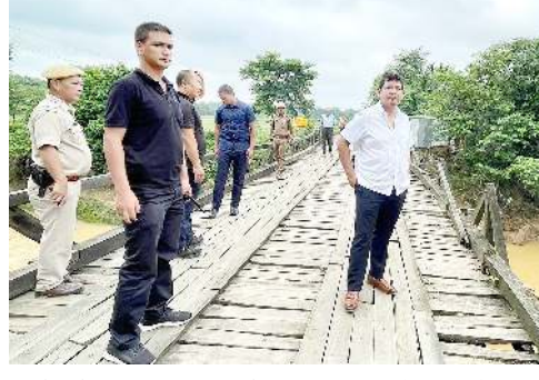
দিপাৰ্টমেন্টশিংদা খঙহনথ্ৰে। স্টেট অসিদা হৌখিবা নুমিং খৰনি অসিদা

শিল্লোং, জুন ২২ (এজেসি): মেঘালয়গী মনুং চনবা ঈচাওনা কা হেমা শোকহল্লবা গাৱো হিলসকী শৰুকশিংদা স্টেট অসিগী চীফ মিনিষ্টৰ কোনৱাদ সংমানা হকথেননা চত্ৰুনা য়েংশিনথিবা লোয়ননা মৰী লেনবশিংদা ঈচাওনা মথা তানা চৈথেং পীহল্লতনবা থবকশিং পায়খনবা খঙহনথ্ৰে।