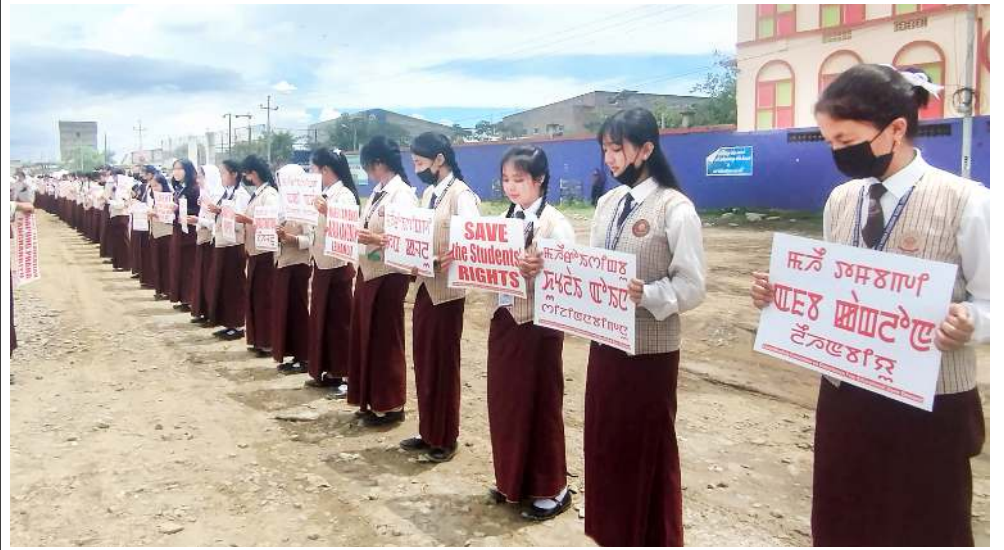
দিষ্টৰ্বেস ফ্ৰি এদুকেন্সেল জোন ওইহক্ৰু হায়না দিমাশ্দ তৌৱদুনা স্টেণ্ডৰ্দ ৰোবট হায়ৰ সেকেদৰি স্কুলগী মহেৰোয়শিগা হ্যামেন নেন শেমখিবা

মীশক অমা ওইদুনা লাল্লিবা একমাথ শিদ্দেনা ফোঙদোকখিবদা হৌজিক লৈৱিবা লুইংলি অসিগী মায়োক্তা মখোয়না লেপ্ৰবসু বলাসহেৰে থাক্ৰেনা পামজৰৱা লল্লীদা চংকনি হায়রি। নাকল অমরোমদা মহাৰাষ্ট্ৰীয়া চীফ মিনিষ্টৰ উধব থাক্ৰেনা ফোঙদোকখিবদা, মহাৰাষ্ট্ৰীয়া ওইনা লৈৱিবা সিব সেনাগী এম এল এ অমতুনা মহাক্কা চীফ মিনিষ্টৰ ওইবদগী পোখাৰো হায়না ফোঙদোকখিবদা চিনেবা লৈতনা মহাক্কা চীফ মিনিষ্টৰগী ফমদগী ৱিজাইন তৌনবা শেম শাদুনা লৈৱি। মহাক্কা ৱেজিগনেসন লেটৰ হায়না ইদুনা থল্লে। অদুৰ মতেপ্পা কনাগুৱা অমতুনা পেদবা ফোঙদোকখিবদা লৈৱি। গুৱাহাটীয়া লৈৱিবা এম এল এ এশিং অদু একমাথ শিদ্দেনা নমথাক তৌদুনা পুৰুগা চংখিবা গভৰ্নি হায়রি।